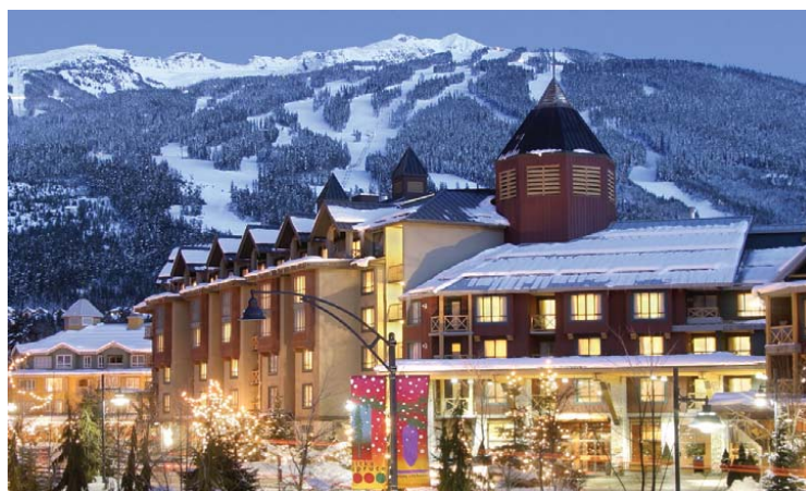
Hôtel Whistler Village Delta, Colombie-Britannique

Les places sont limitées, inscrivez-vous dès aujourd'hui - Pour plus d'information sur ce cours et pour vous inscrire, veuillez activer ce lien : Cours de niveau avancé